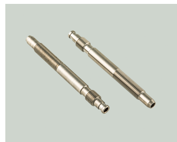
超音波メス用ボルト/チタン