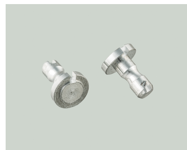
歯科医療用レジブロック取り付け治具/ アルミ

空調機器、空圧・油圧制御機器、半導体関連、自動車関連向けの精密切削部品を継続して加工しています。医療分野では歯科医療器具等に継続的に実績があります。特に、ハンドピース（歯を削るための機器）の基