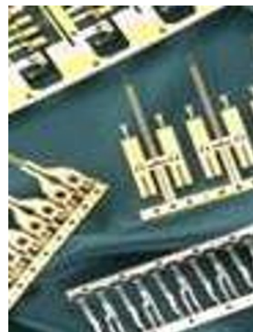
各種フラットスプリング製品