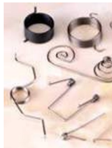
各種ワイヤースプリング製品

得意技術として、押しばね、トーションばね、ワイヤーフォーミングなどのワイヤースプリング、精密プレス品、マルチフォーミングなどのフラットスプリングがあります。中でも高精度対応、クリーンルーム対応が可能のため、医療機器への搭載に好適です。また、深絞り、インサート成形、組立などの保有技術と組み合わせることで、高機能なアセンブリとしての提供も可能です。