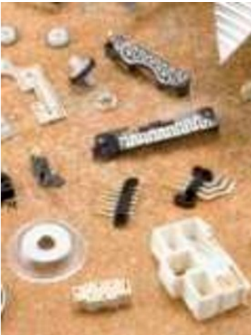
各種インサート成形製品