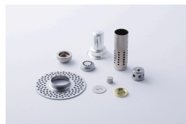
車載用安全装置向け部品