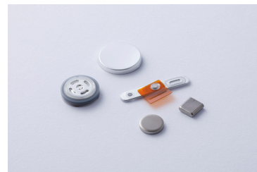
航空宇宙用電池部品/チタン・アルミ製品