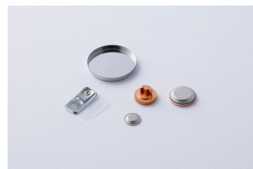
医療用電池ケース/電池蓋/レーザー部品

当社精密プレス加工は半世紀にわたり培った技術力とミクロン台の品質管理を強みとしており、チタン材加工の開発も精力的に行っております。また照明分野では自社開発の防犯灯等を製造販売しております。医療用部材製造や照明機器についてぜひご相談ください。