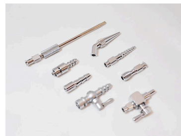
ルアーロック特注品