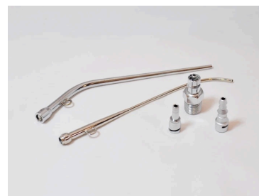
耳鼻咽喉科用器具