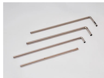
計測機器の先端部品