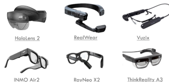
ハンズフリーに対応