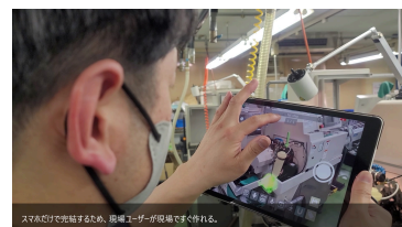
スマホ/タブレットのみでも作成可