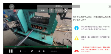
手順書としての動画