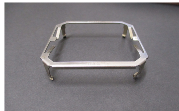
プレス製品 (ヒートシンク用金具)