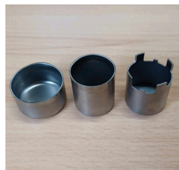
深絞りプレス製品（モーターケース）