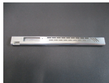
全長148mmのアルミ製異形深絞り加工品

金型製作からプレス加工まで金属プレスのあらゆる工程に精通。技術の蓄積は80年以上。精密な技術力を活かし、医療分野で必要とされる精度や仕上がりをお客様と共に追及いたします。外科手術に使用するチタン製インプラント製作などの実績もあります。