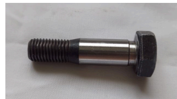
リーマボルト（組み合わせるのに適した寸法に加工）