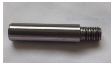
ネジ付きピン（ネジ山を傷つけない高精度な加工）