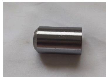
ピストンバルブ（最適な量の空気圧を供給可能）