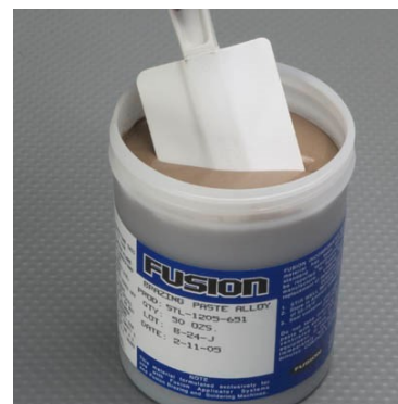
ペースト状の銀ろう FUSIONペースト