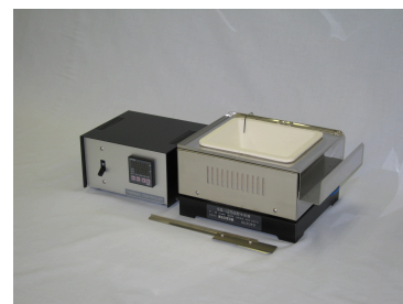
金属成分の混入がないセラミックはんだ槽

熱風ヒーターは医療機器に求められるバリの除去や内視鏡の銀ろう付に、採用されており、カスタム品のご相談もお受け致します。