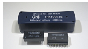
IEC60601認証LAN絶縁トランス

トランスの開発、設計、製造、販売をしているメーカーです。カスタムトランスのご提案が得意です。20社以上の医療機器メーカーへのトランス供給の実績から、トランスに関する医療機器への規格に対応できる設計ノウハウがございます。