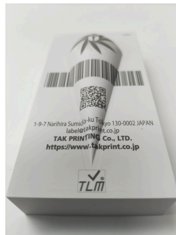
3Dレーザーマーキング加工