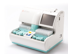
便潜血全自動免疫化学分析装置（筐体デザインを担当）