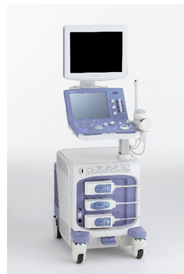
超音波画像診断装置（筐体設計、筐体デザインを担当）

長年医療機器開発に従事してきた経験を活かし、医療従事者とエンドユーザーにとって心地のよい体験となるような製品開発をサポートいたします。