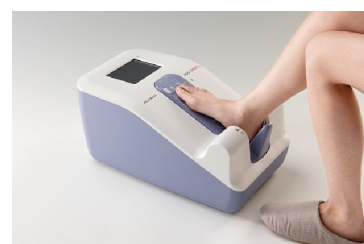
超音波骨密度測定装置（筐体設計、筐体デザインを担当）