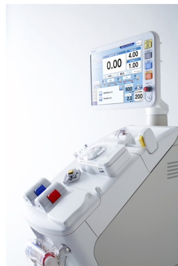
透析用監視装置（筐体設計、筐体デザインを担当）