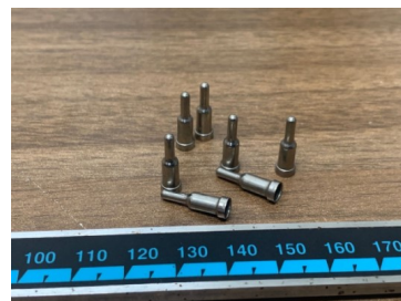
温度センサケース ステンレスの深絞り加工

手術支援ロボット用鉗子の製作、医療施設で使用される検尿カップの板金部の加工支援、歯科用ドリル先端のカバー製作、医療機器用モータのハウジング・ブラケットの量産、化粧品関連アルミカラーケースの生産、OA機器用マイクロ電磁クラッチ部品の生産