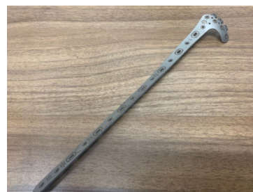
整形外科用モデルインプラント