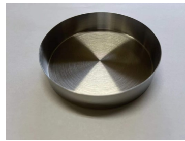
ステンレス製シャーレ