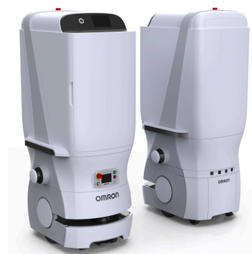
汎用型搬送ロボット