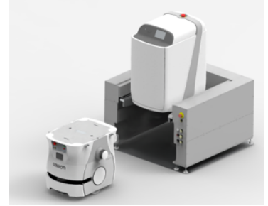
上物ユニットの交換