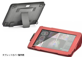
タブレットカバー製作例