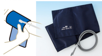
血圧計に使用する腕帯