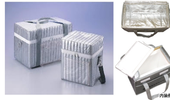
検体輸送ボックス