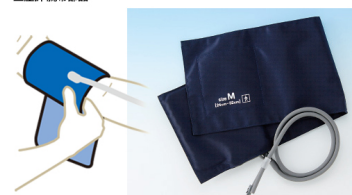
血圧計に使用する腕帯