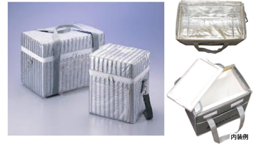
検体輸送ボックス