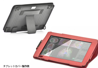
タブレットカバー製作例