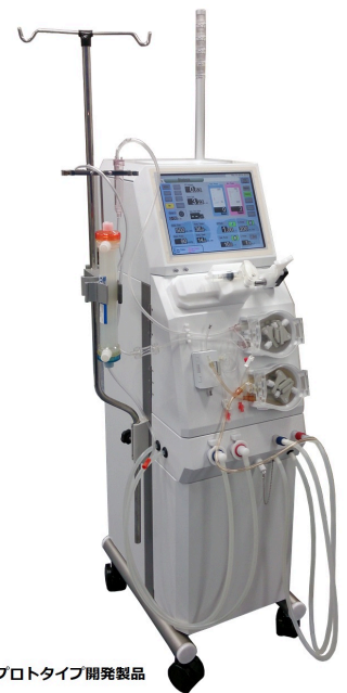
プロトタイプ開発製品