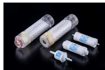
水用中空糸膜フィルター