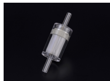
エア用中空糸膜フィルター