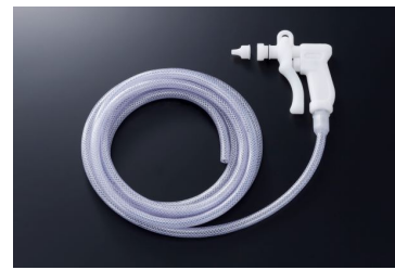
医療器具洗浄用ウォーターガン