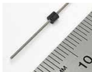
φ 0.6mm の極細すべりねじ + 樹脂ナット