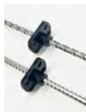
大リードすべりねじ